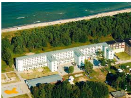
Jugendherberge in Prora auf Rügen

Behindertengruppen und ihre Be-treuer, integrative Ferienfreizeiten,