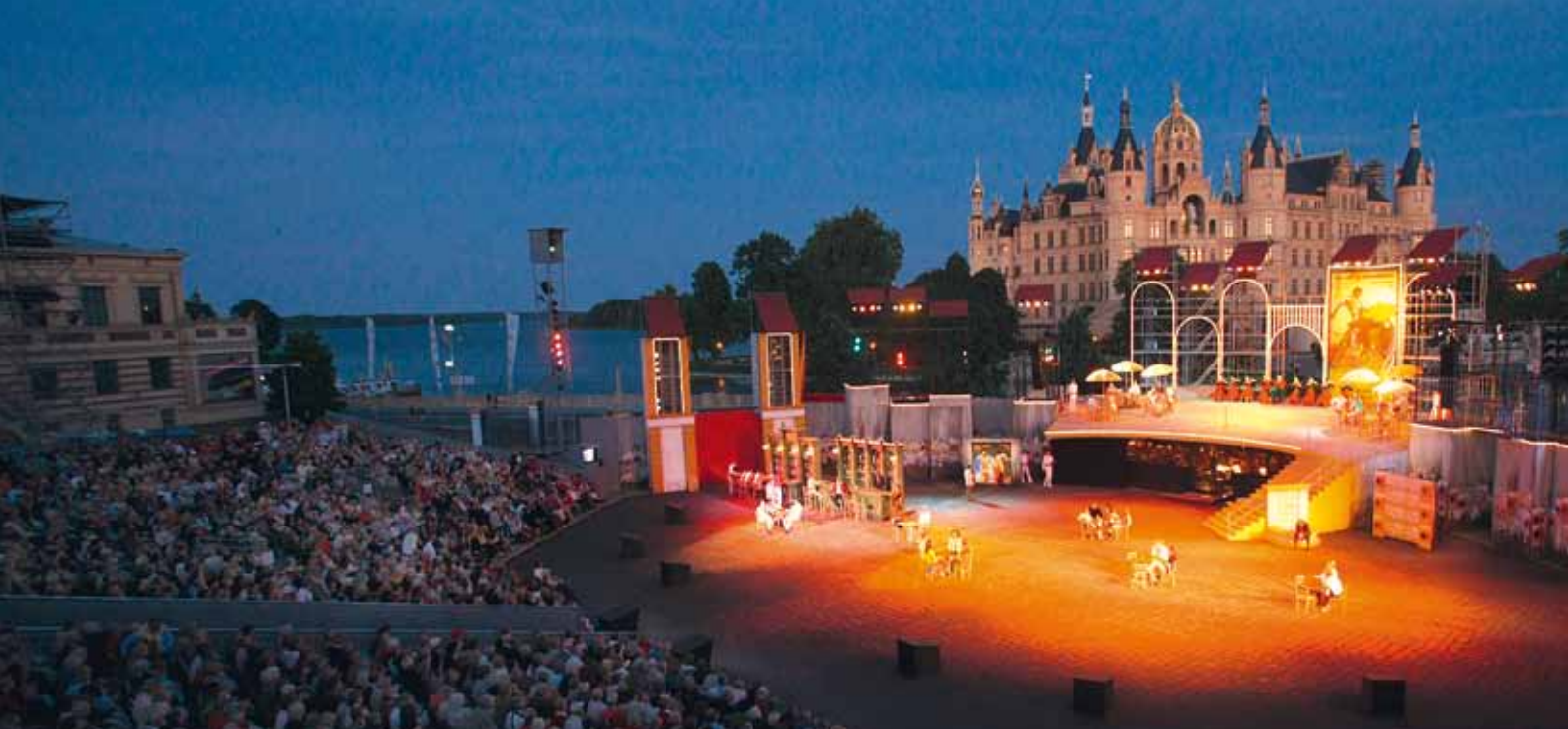
Großes Theater bei den Schlossfestspielen Schwerin