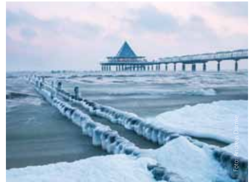
Alle Jahreszeiten genießen