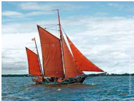
Zeesboot in voller Fahrt

endlosen Küstenlinie beobachten. Immer wieder formen Wind und Wellen das Land neu und spielen aufmerksamen Strandspaziergängern kleine Brocken Bernstein in die Finger. Auch Menschen mit Mobilitäts- oder Sinneseinschränkungen können sich den Nationalpark durch barrierefreie Aussichtsplattformen, Führungen mit geschulten Rangern oder mit eGuides leicht erschließen. Die