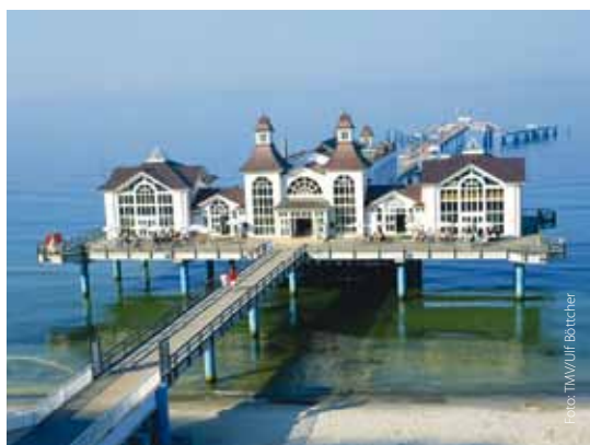
Märchenhafte Seebrücke in Sellin

Rügen schafft neben zahlreichen barrierefreien Strandzugängen, rollstuhlgerechten Unterkünten und Toiletten immer bessere Bedingungen für barrierefreies Reisen. Selbst der Nationalpark ist, mit Ausnahme des Königsstuhls, rollstuhlgeeignet. Infoblätter in Brailleschrift und Tastmodelle führen Blinde durch die Ausstellung.