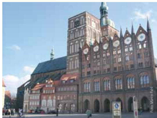
Rathaus im Stil der Backsteingotik

wachsen gotische Backsteinkirchen und mittelalterliche Kloster in den Ostseehimmel und geben Orientierung in den Gassen aus puppenstubenhaften Fachwerk- und Barockhäusern. Abgesenkte Bordsteinkanten und Granitplatten entlang des Kopfsteinpflasters ermöglichen auch Mobilitätseingeschränkten ein Entdecken der Altstadt. Sehbehinderte können Audioguides nutzen