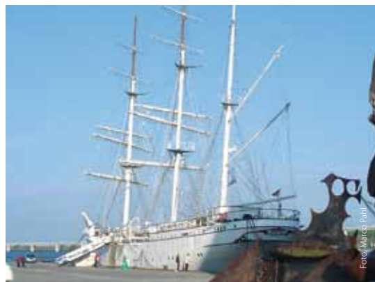
Weitgereister Dreimaster Gorch Fock