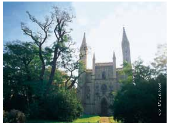
Schlosskirche in Neustrelitz

TOURISMUSVERBAND MECKLENBURGISCHE SEENPLATTE E.V.