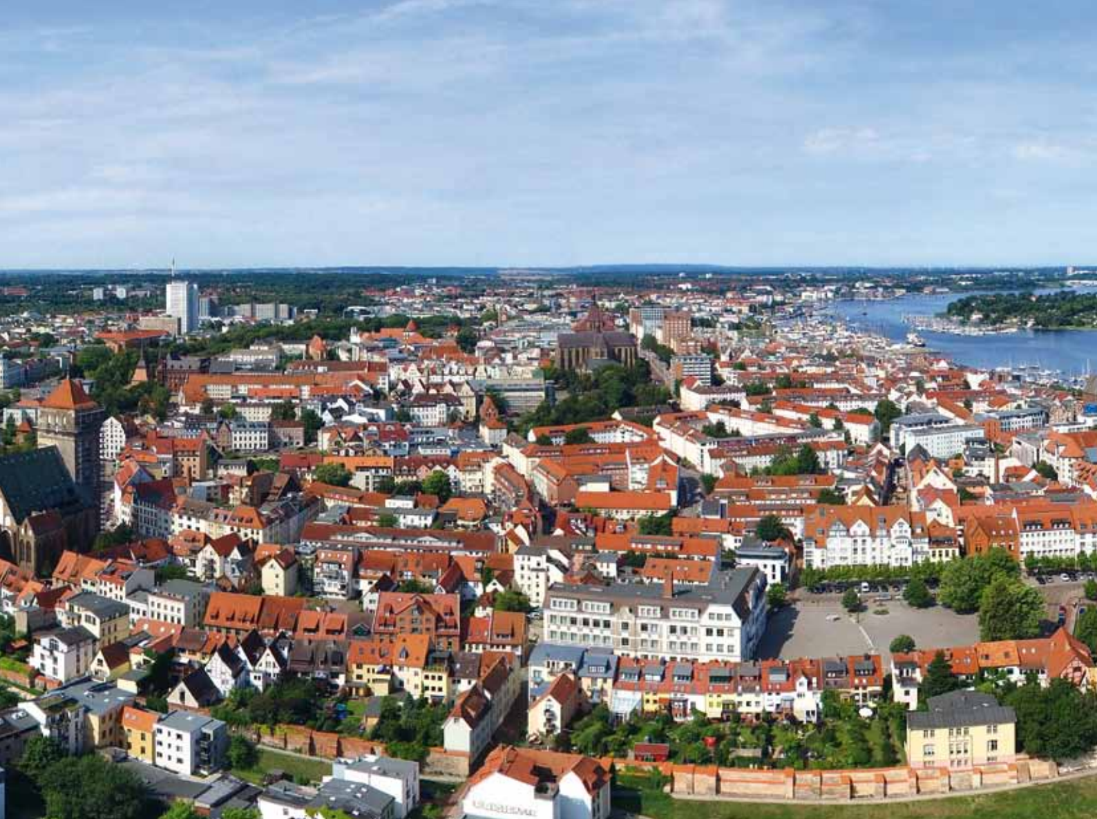
Die strahlende Hansestadt Rostock

ROSTOCK ist nicht nur Universitätsstadt, sondern auch Wirtschaftsmetropole Mecklenburg-Vorpommerns. Der Stadthafen mit seiner breiten Uferpromenade vermittelt die Anbindung zur großen weiten Welt. Unzählige kleine und große Segelschiffe und Yachten scheinen zu versprechen: Hier ist jeder willkommen! Und Rostock stellt sich auf unterschiedlichste