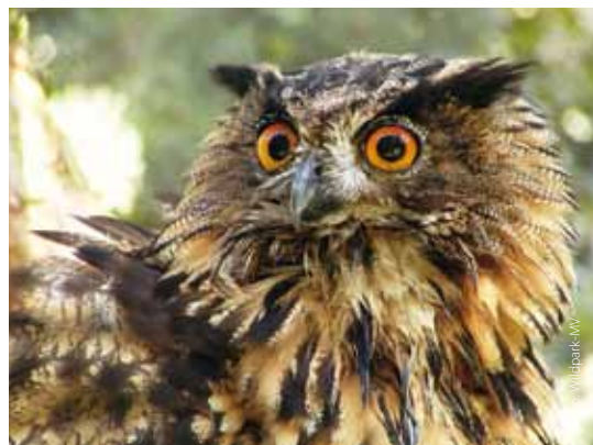
Auf „Du und Du“ mit dem Uhu