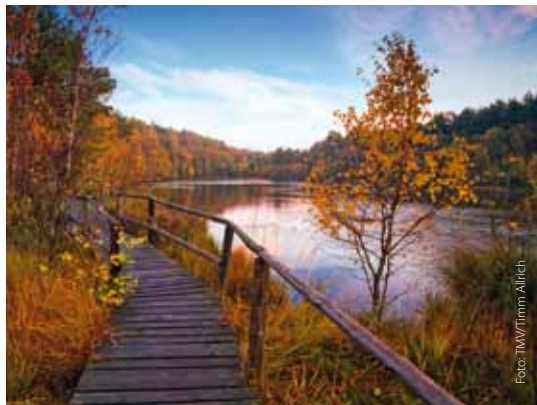
Faszination Herbst im Müritz-Nationalpark

stuhl befahrbar. Beobachten Sie Greifvögel auf ihre Beute stürzend und Zugvögel bei ihrer Rast. Ins Wasser gelangen Sie über rollstuhlgerechte Badestege am See oder in Waren an der Müritz ins Solebad. Die Müritz ist der größte See, der vollständig innerhalb Deutschlands liegt. In der Kanustation Dobbertin erleichtert ein Lift Mobilitätseingeschränkten das Einsteigen in ein