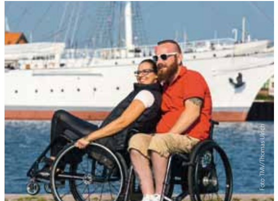
Mit der „Gorch Fock“ in Stralsund

Seit 2011 besteht das bundeseinheitliche Kennzeichnungssystem „Reisen für Alle“ - seit 2016 wird es auch in Mecklenburg-Vorpommern umgesetzt. Viele der in dieser Broschüre vorgestellten Betriebe haben sich nach „Reisen für Alle“ kennzeichnen lassen oder befinden sich im Zertifizierungsprozess. Dies sorgt für Transparenz und bietet Ihnen die Möglichkeit, Ihre Reise besser zu planen. Informationen finden Sie unter: www.auf-nach-mv.de/barrierefrei oder auch auf www.reisen-fuer-alle.de