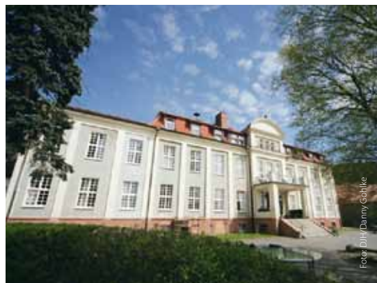
Unterkunft in Burg Stargard