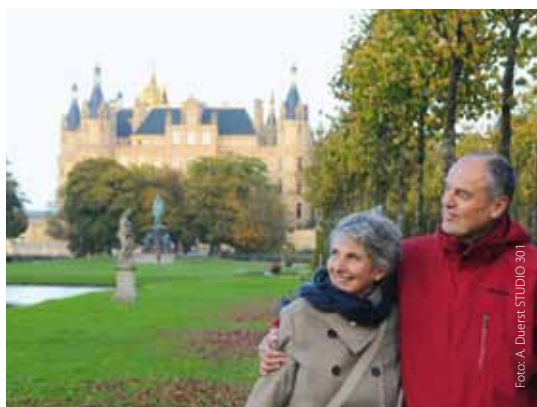
Flanieren durch den Schlossgarten