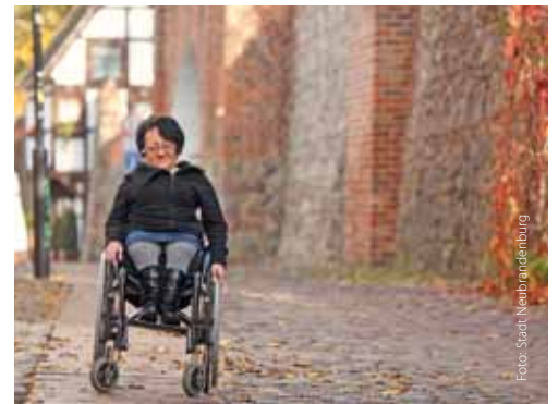
Entlang historischer Wallanlagen

Tonübertragungsanlage Menschen mit eingeschränktem Hörvermögen besten Klanggenuss. Ein Tastmodell auf dem