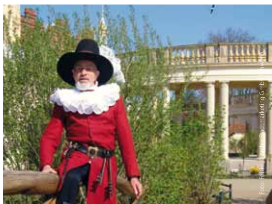
Der Geist des Schweriner Schlosses - das Petermännchen

und rollstuhlgerechte Rundgänge gestaltet worden. Ähnlich imposant reckt sich der 117,5 m hohe Dom über die meist niedrigen Dächer der bildschönen Altstadt. Als gotischer Backsteinbau ist er das älteste und einzige mittelalterliche Bauwerk Schwerins. Der Dom hat barrierefreie Zugänge und bietet spezielle Führungen für Sehbehinderte und