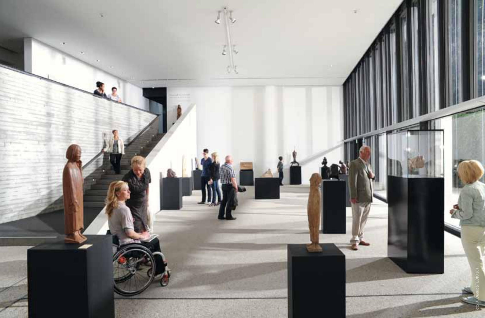
AufTuchführung mit Ernst Barlach

Im Wildpark-MV finden auch barrierefreie Führungen statt – auf rollstuhlgeeigneten Wegen, vorbei an Bären, Wölfen und Eulen. Das Erlebnisbad OASE